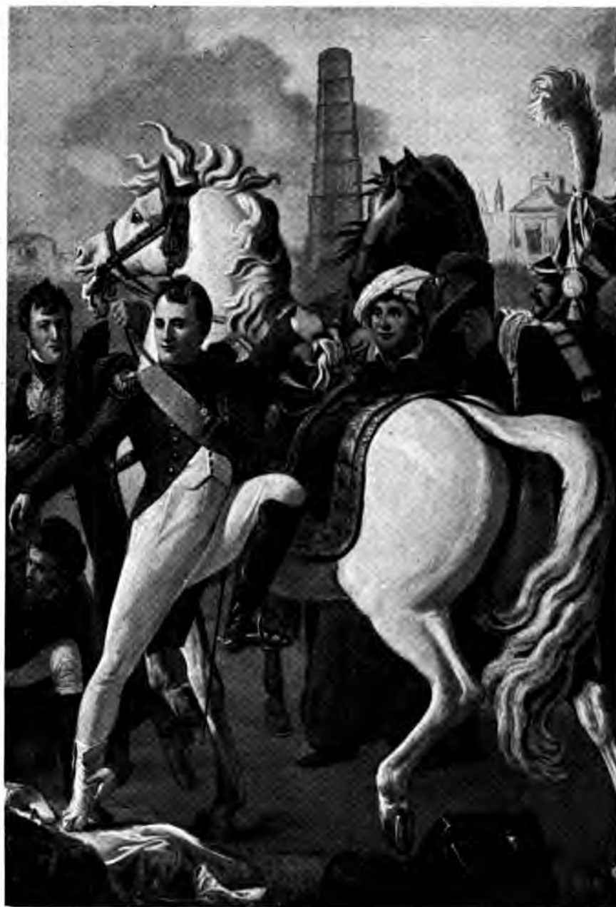
NAPOLÉON I er BLESSÉ A RATISBONNE par Gautherot.